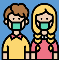
สวมหน้ากาก

หมั่นดูแลใส่ใจสุขภาพกายสุขภาพใจต้าน COVID-19 กันนะคะ