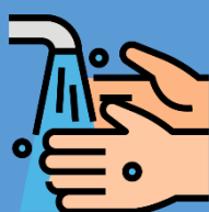
หมั่นล้างมือ