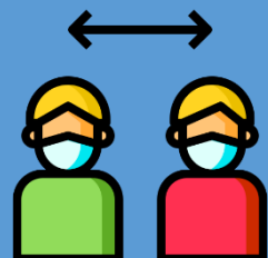
เว้นระยะห่าง